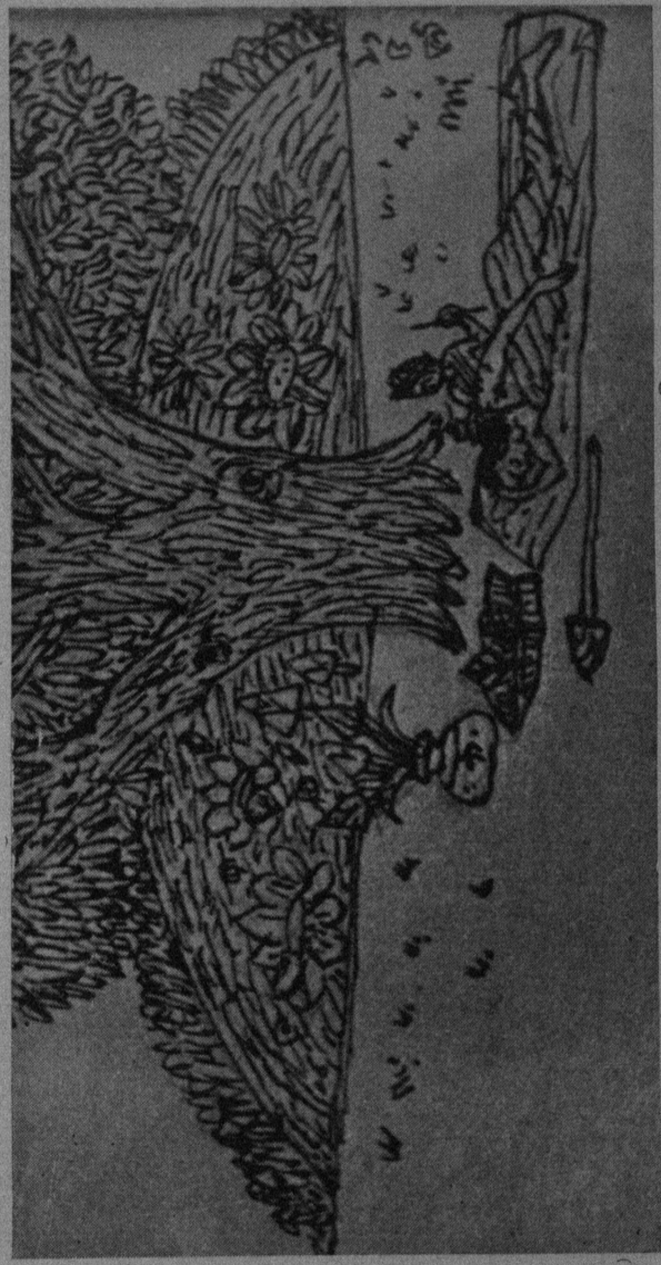
কালিকাপুৰ পুথিৰ আৰ একটি পৃষ্ঠা

॥ না জেনিয়া বিবিকোই হুঁ দ্যাবে ॥ কই এমবেয় বিফকা গবে গোলে । মউসাব বিবিভোদোসম্বন্ধে ফোলে ॥ বাত্রোচিদি ওপি মাত্তোদি এনুপাম । এখাই বোনাতে চান্তু জেবা তিনাম ॥ বাপুব্বাকোপা যুযা বিতরিফা পাম । ফা স্তিকি কামিগা কাকসাতাপা মণ্ডানি ॥ চন্তু বিতে আত্তমাবেপাটিকানপা চিবে । মানবাক্যাহাটে বাবে শ্বেবুৰু কথিব ॥ মাগৰকাবান্দে বিস্বাকুশনাব । সেমা খানায়ে স্তেগব কো হুত্তেব সেমবেৰকবিতে পস্থিত ॥ ৩৫ কেপবেদে কোব মপিনজাথে দেবতাৰে প্ৰিয় জোডহাথে । ইম্বাতি তেহানী । কোপাই যো চান্দমপে বিয়ৰযাখনী ॥ ৩৬ মবেজাদেবে হো ক্ৰিা দ্ধিব । এত্তোভাবে ব্ৰেজো জ্যাবিকোছা যাবি ॥ পাৰ্শ্বত্বে পৰমেয় বিপাক্ষৰ সস্তান । ধবান আগমে প্ৰেবদি তে সজানি ॥ এজায়া মশু বা মা মা ব্ৰেজো হাৰিছাব । কেয়দি তপাৰে হুই মাছিমা সোমাব ॥ ৩৭ বিপ্ৰেবে কৰা বিপ্ৰি বগতিমা । কেবা নিউপাৰে মাতোমাৰু সাহিমা ॥