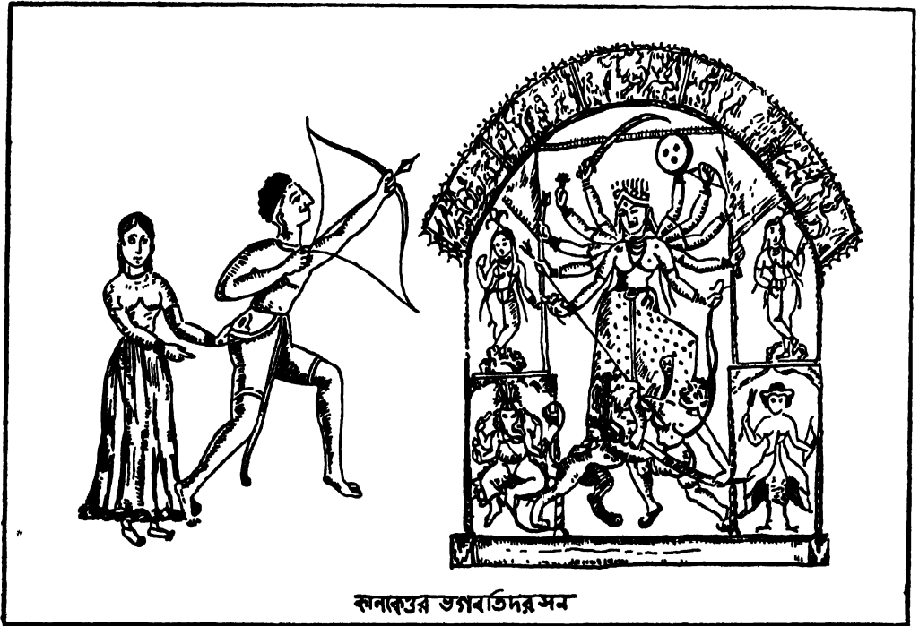
কানকেশ্বর ভগবতীদর সন